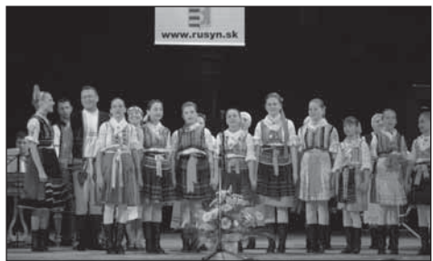
▲ Завершална сцена концерту А чія то хыжа...