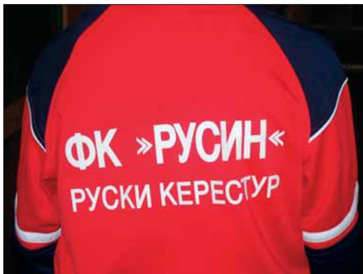
▲ Парадный дрес сербского фотбалісты.