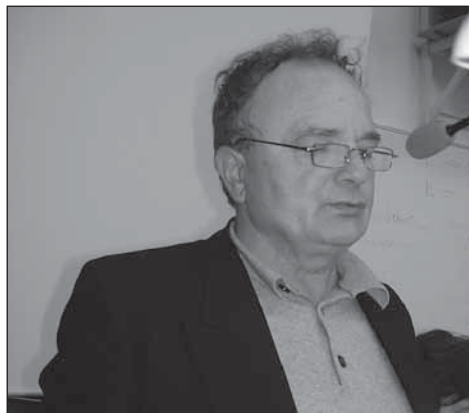
▲ Ш. Сухый декламовав на семінарі властный стихок.

шены выслушати 13-рефератовый маратон, было ненормалным. А были то рефераты, котры ся не операли о кодифіковану аплікачну сторону языка (честь окремым авторам).