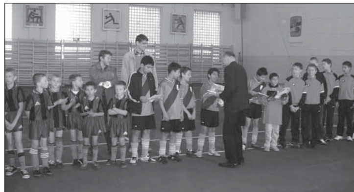
▲ Репрезентація нашой Карпатії переберать медалы за своі выkony

Подля слов Ф. Віца: Карпатія Пряшів єствує на добровольній базі, не маме ніякы фінанції на екзистенцію клубу. Сам дома райбам дресы про хлопців і давам до того свою енергію. Але фурт высловую єдну заважну думку, а то: футбол мать грати тот, хто хоче, а не тот хто є до шпорту силений. Ромове суть шыковны і хотять грати, а то є про мене дівізія до будучна. Хоць ня мерзить, же днесь на тім турнаю ем неміг видіти свою кров. Довго сьме глядали у Пряшові молодых Русинів, абы грали фотбал, но жаль ніхто не при-