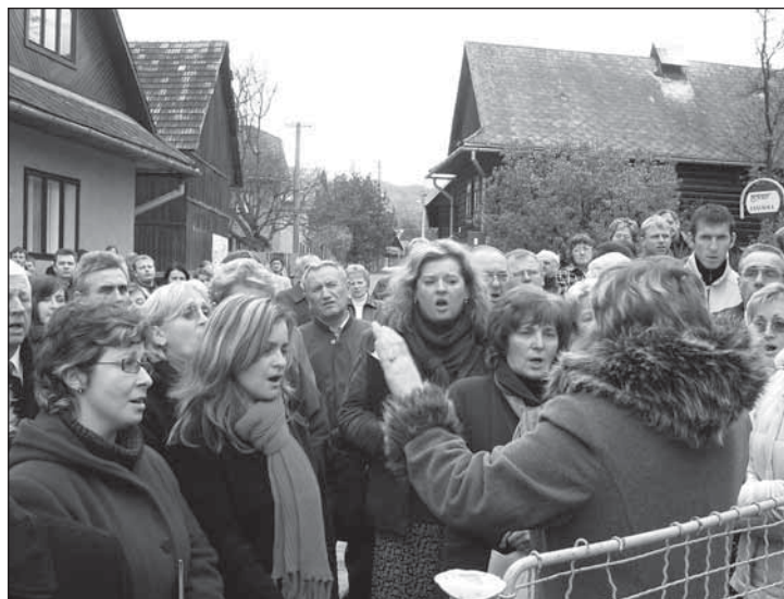
▲ На святочнім акті заспівав і снаковскый грекокатолицькый хор.

Як интересность треба додати, же іщі перед спомянутов акцій у Снакові, ся 6. октября 2007 одбыло Симпозиум в мадярськым селі Гомрогді тыж