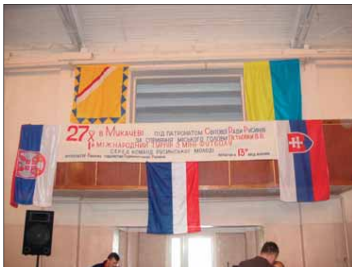
▲ Погляд на заставы і вітаючу пропаґацію молодых шпортовці в Мукачеві.

Карпатию, абы могла іти грати фотбал до Мукачева, хоць нас мерзить, же нихто зо Світової рады Русинів нас о тій акції не інформовав. Нияку по-званку сьме мы, як організація не достали. Дознав ем ся то лем од заступців Карпатії пару дні перед турнаюм, коли уж было тяжко і пізно зогнати наших хлопців-Русинів. Знам, же є дость хлопців в регіоні, котры знають грати фотбал а мали бы дяку грати. Але вірю, же до будучности будуть на такім вызнамнім турнаю про русиньску молодеж Русинів репрезентувати Русины.