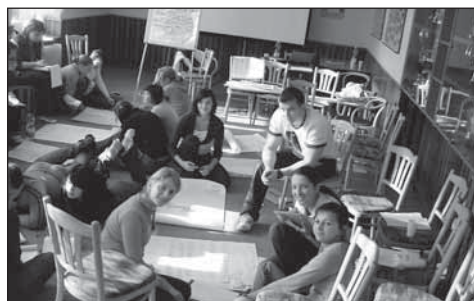
▲ Робоча атмосфера при приправі проєкту