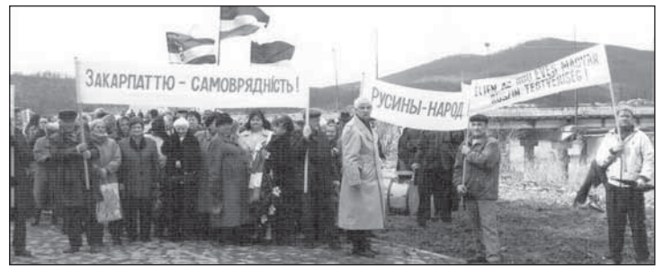
▲ Маніфестація в Мукачеві.

а може то пошкодити лем Русинам. Єднозначні ся діштанцуєме од Выголошіня 2. Европского Конґресу Закарпатьскых Русинів. Треба зробити научну дискузію на цілоштатній уровни меджі науковцями і лідрами русиньскых організацій на Україні