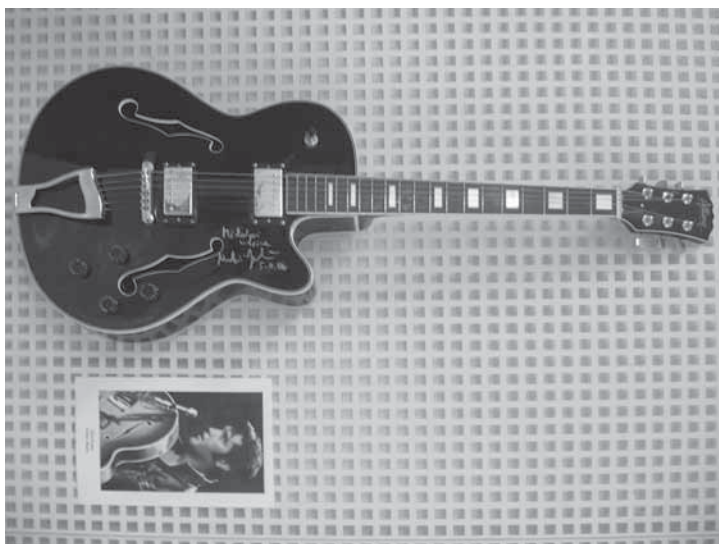
▲ Фото з выставки ґітар з приватной збіркы М. Бицька, де была і ґітара, на якій колись грав Елвіс Пресли.

Думам, же фестивал токого характеру не є великов силою Русинів. І кедь сьме здобыли вельо цін, так може і зато, же ту не была велика конкуренція. До