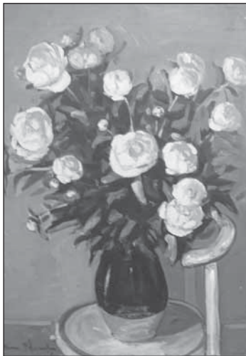
▲ Єден з образів (олійомальба) маля- ря І. Шафранка.

В дакортых образах, переваж- но в абстрактных, видно много сімболів добра і зла з нашого каждоденного живота. Іншы в нас выкликують гармонію і добры контакты меджі людми, як є при-