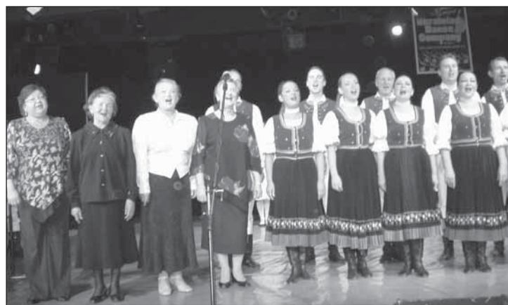
▲ Стары і молоды Піддуклянці собі заспівали - Ей, заспівайме собі, ний буде весело.

ся їх пригослосить. Ту требало раховати із едным малым „пре- квапком“, же каждый собі вшыт- ко - страву, обчерствїня і остатні выдавкы заплатити сам. А снага