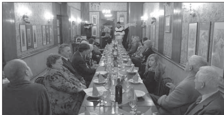
▲ Погляд на святочне отворіня Віфлеемского вечера в Пряхові.

Єдно з великога множества культурных акцій, котры Русиньска оброда на Словеньску (РОС) організує, суть і Віфлеемскы вечеры. Звыкы Русинів на Рождество Ісуса Хрыста доказують, же богаты русиньскы традиції і фолклор суть тісно повязаны з хрыстіяньскыма прядзнікама. Уж перед 16-тьома рокама кедь свідницькы Русины зорганізовали першы Віфлеемскы вечір, сьме ся на властны очі пересвідчили, яке маме величезне богатство репертоару з рождественных свят – рождественных гер про дітей і дорослых, колядок, вінчовань... Днесь уж може ані ніт такой організації РОС, котра бы у тым передрождественнім часі не організовала в своїм селі ці місті Віфлеемскы вечір.