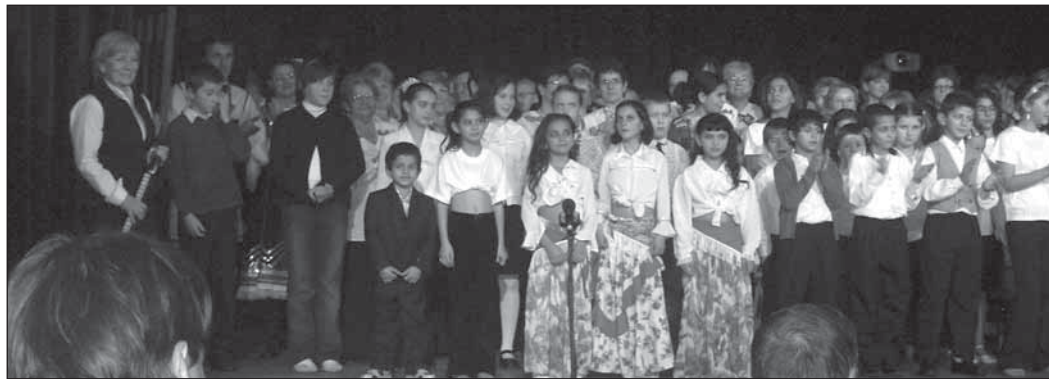
▲ XI. Вечір народностных меншын в Кошыцях.