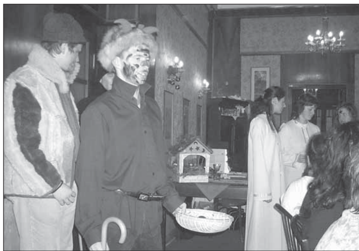
▲ Колядници на Віфлеемскім вечері в Пряхові.