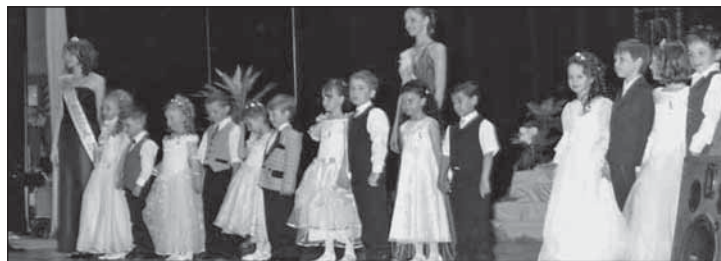
▲ 3. річник МІС МШ в Меджілабірцях присвяченій вшиткым мамам зорганізовало в недавных майовых днях місто Меджілабірці в сполупраці з Містськым культурным центром. Сім маленькым фіналісткам пришли на поміч і недавны дорослы МІСкы.

Позывае вас на концерт і уведжіня до жывота ЦД Ой забава –