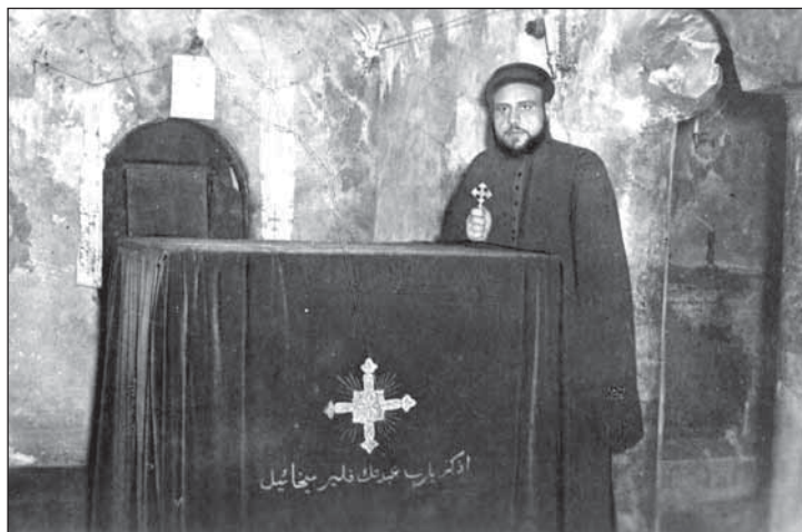
▲ На тім місці перебувала св. Родинка

уж знали, же перебуваня в Егіпці ся продовжує до януара 1962, попросили сьме кухаря, ці бы знав наварити нашу капустніцю. Одповідь нас потїшыла, іщі нам капустніцю выліпшыв кобасками, котры в Кагірі робив Ракушан, родом прямо із Відня. На Вілію по вечері нас кухарь закликав і з цілов його родинов на Велике Повечеріе до їх храму. Тот старый