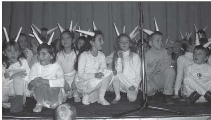
▲ Школярі з домашньої ОШ ся представили своїм жытелям з приповідковов еров о козлятках.