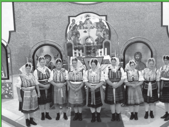
▲ На фото співацька група зо Шарішского Ястрабя.