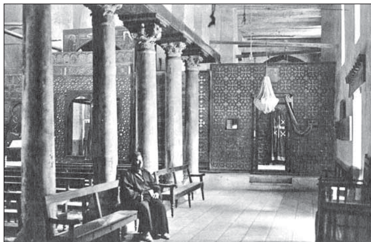
▲ Храм Коптской православной церькви. Ту ся св. Родинка сховала перед Геродесом

каждый ся дав до писаня письма домів – своїм женам. Моє письмо было довге, бо зажитків было вельо, але найглавнійшый був смутток, же уж другый рік на праздник Рождества Ісуса Хрїста не можу быти ведно із своїов родинов і не зажити атмосферу Святого вечера. Потїхов мі было письмо од жены, же дома собі зробиме Святы вечур зо вшыткым,