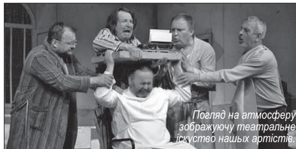
Погляд на атмосферу зображуючу театральне іскусство наших артистів.

4. 9. Камюнка ОШ 12. 9. Гостовіці ОШ 19. 9. Чабины ОШ 26. 9. Убля ОШ