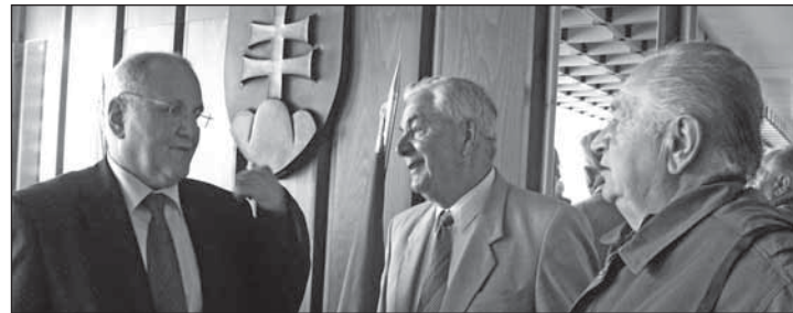
▲ Vicepremiér SR Dušan Čaplovič pri intenzívnom rozhovore so Svidničanmi.

Chceme vytvoriť podmienky pre zriadenie Úradu pre menšiny v SR,